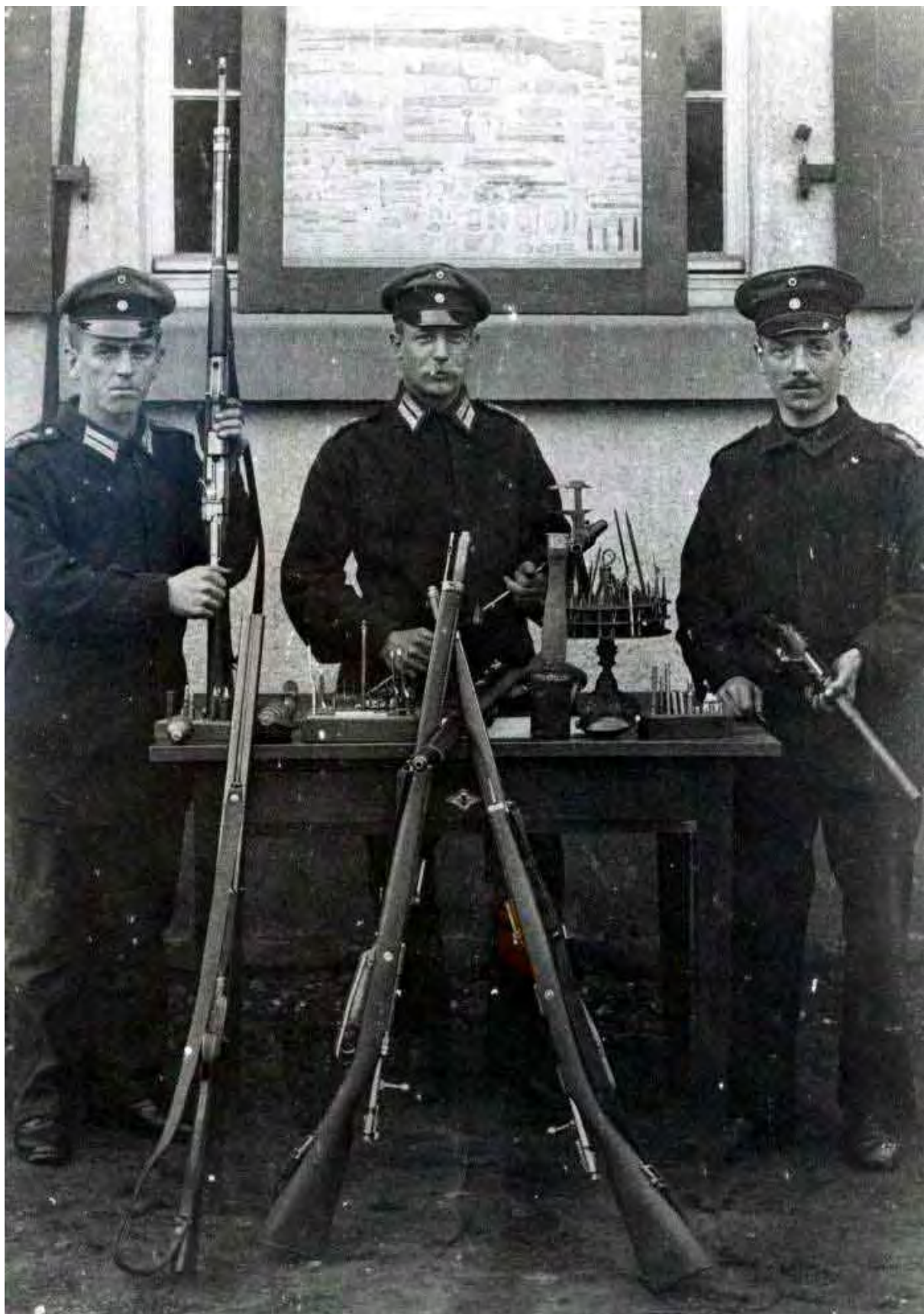
Waffenmeisterei aus dem Königin Elisabeth Garde-Grenadier-Regiment Nr. 3 um 1890