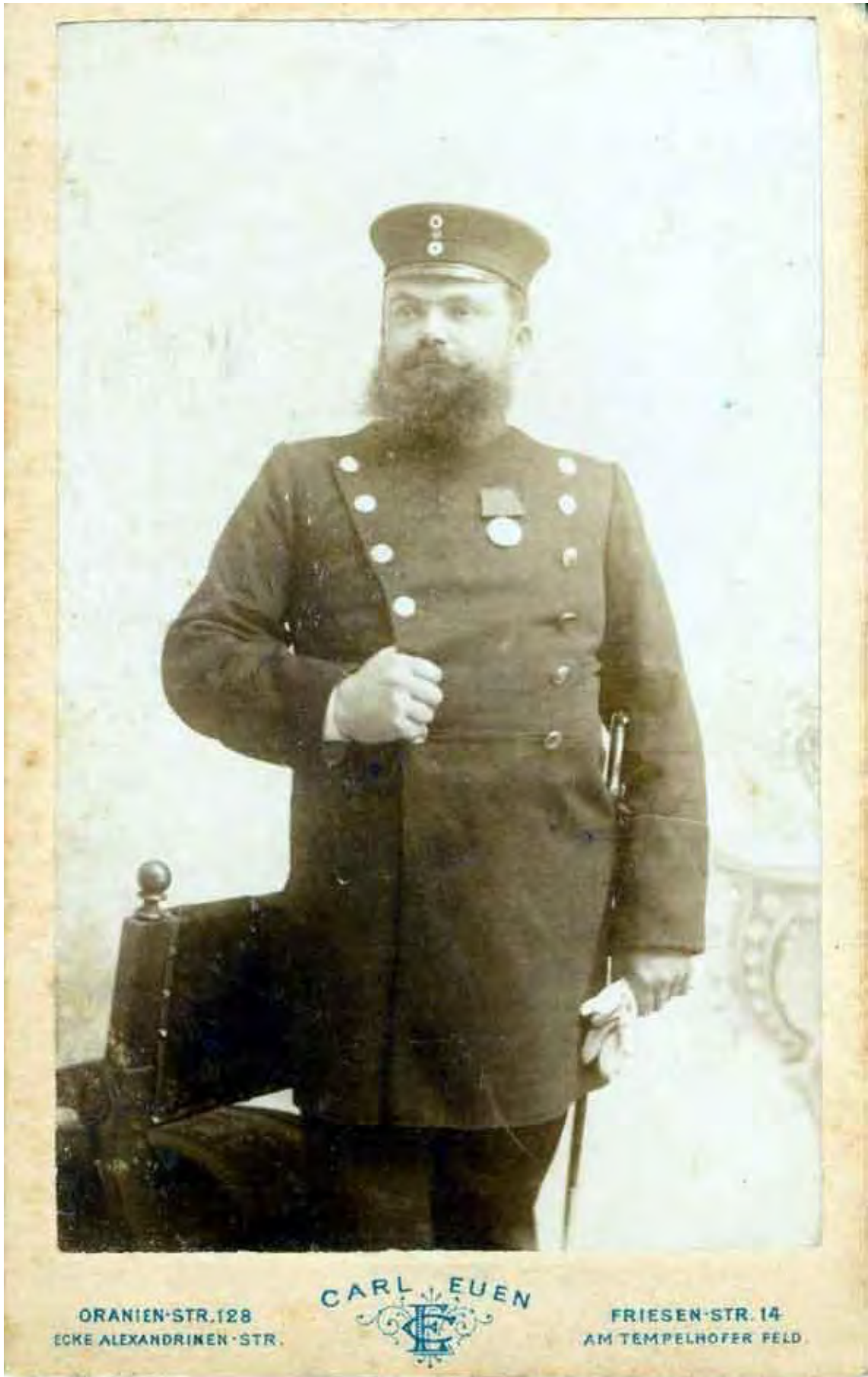
Königlich Preussischer Büchsenmacher / Waffenmeister um 1890.