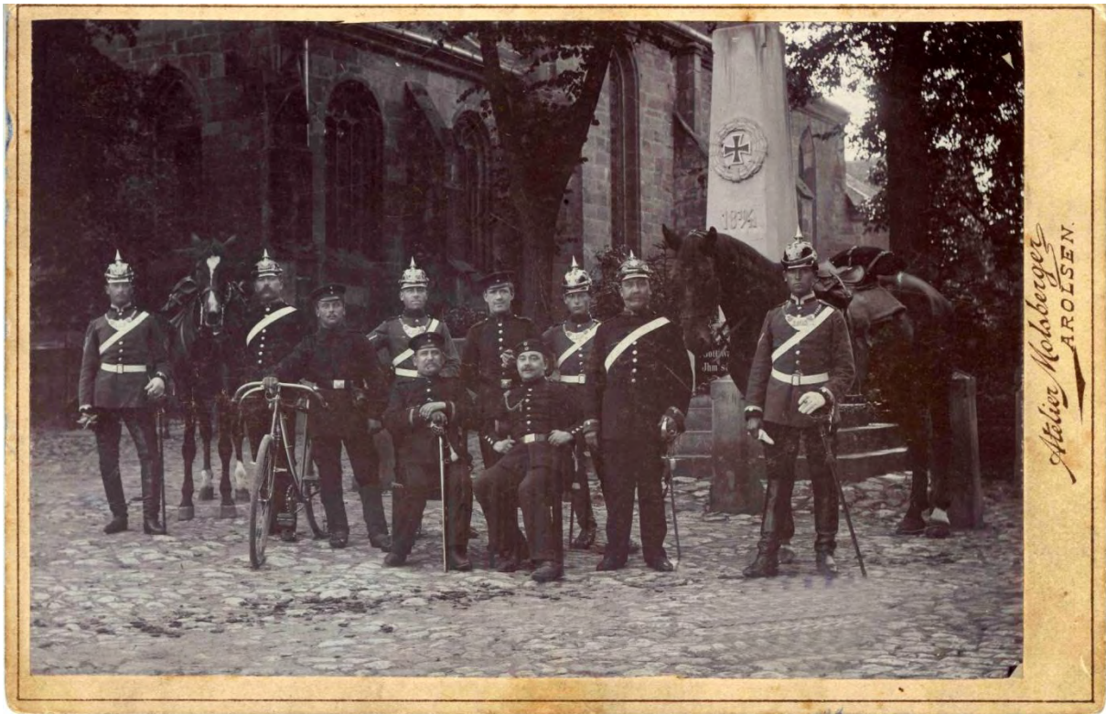
Ein sehr seltenes Manöverbild von Feldgendarmen in Friedenszeiten. Aufgenommen zwischen 1895 und 1901 vom Atelier Molsberger in Arolsen. Rückseitig beschriftet: XX bei der Feldgendarmerie im Manöver . Die Feldgendarmen vermutlich von Dragoner 5, dazwischen 2 berittene Landgendarmen.