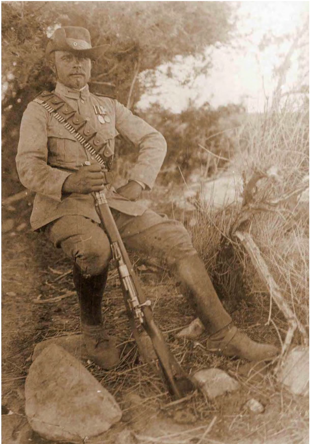
Als Vertragspolizist 1908. Im Gegensatz zu den beamteten Landespolizisten trugen die Vertragspolizisten am Kragen keine Gradsterne.