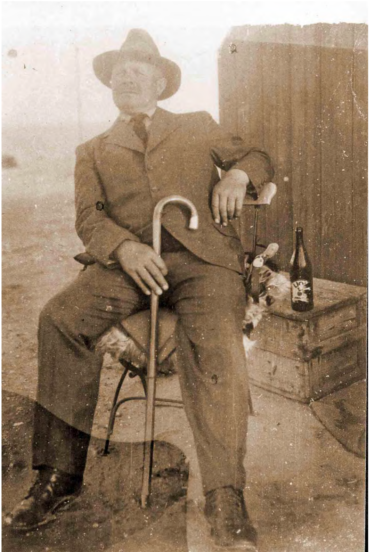
Aufnahme vom 24. September 1928