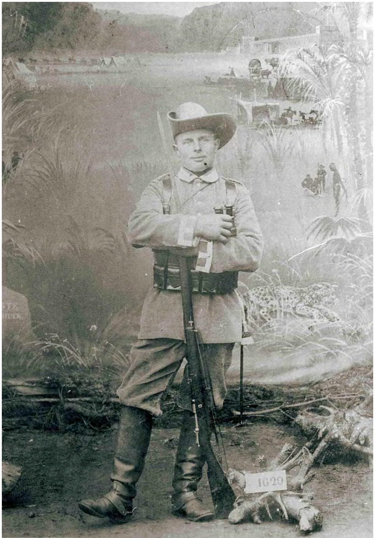
but the number 1629 is on the tag