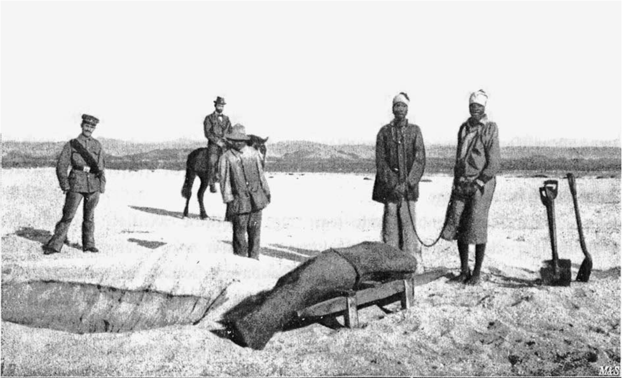
Heidnisches Eingeborenen-Begräbnis (durch Gefangene).