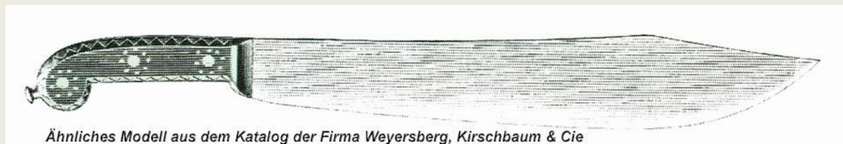
Ähnliches Modell aus dem Katalog der Firma Weyersberg, Kirschbaum & Cie

Eindeutig bestimmbare originale Klapp- oder Bowiemesser aus den Schutzgebieten sind dem Verfasser bisher unbekannt. Das Modell hatte vermutlich aufgenietete Griffschalen und einem nach vorne abgerundeten Griff. Problematischer ist die Frage nach dem Nietkopf. Auf einigen Bildern scheint ein solcher vorhanden zu sein.