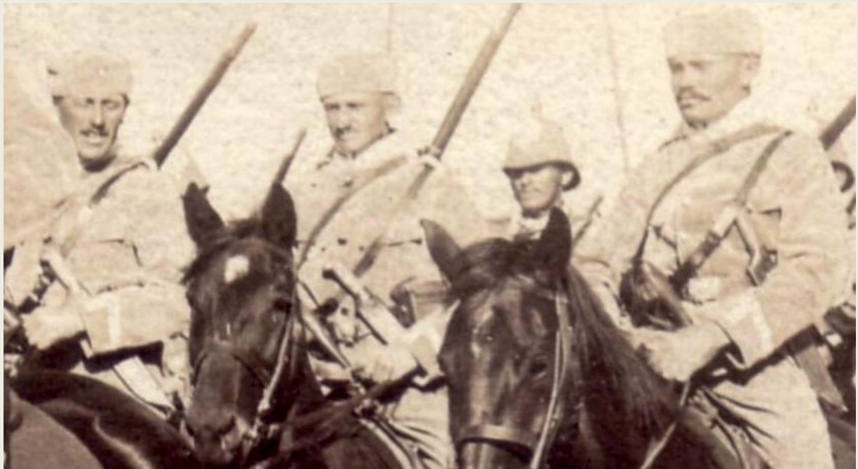
Darstellung der einzelnen Uniformepochen zur Landesausstellung und gleichzeitigem 25jährigen Schutztruppenjubiläum im Mai 1914. Am Koppel Revolver M/83 und das Bowiemesser.