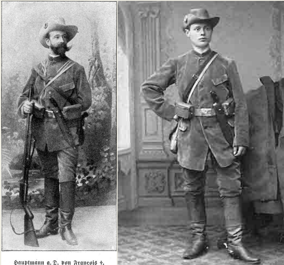
Hauptmann a. D. von François †.