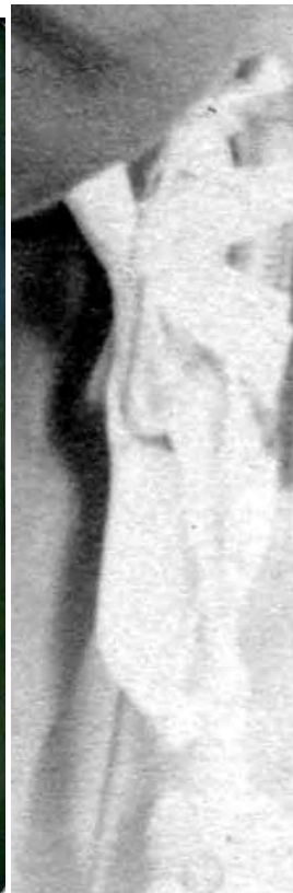
Ehemaliger Angehöriger der Garde als Landgendarm der Landgendarmarie-Brigade 3. Aufnahme um 1888.