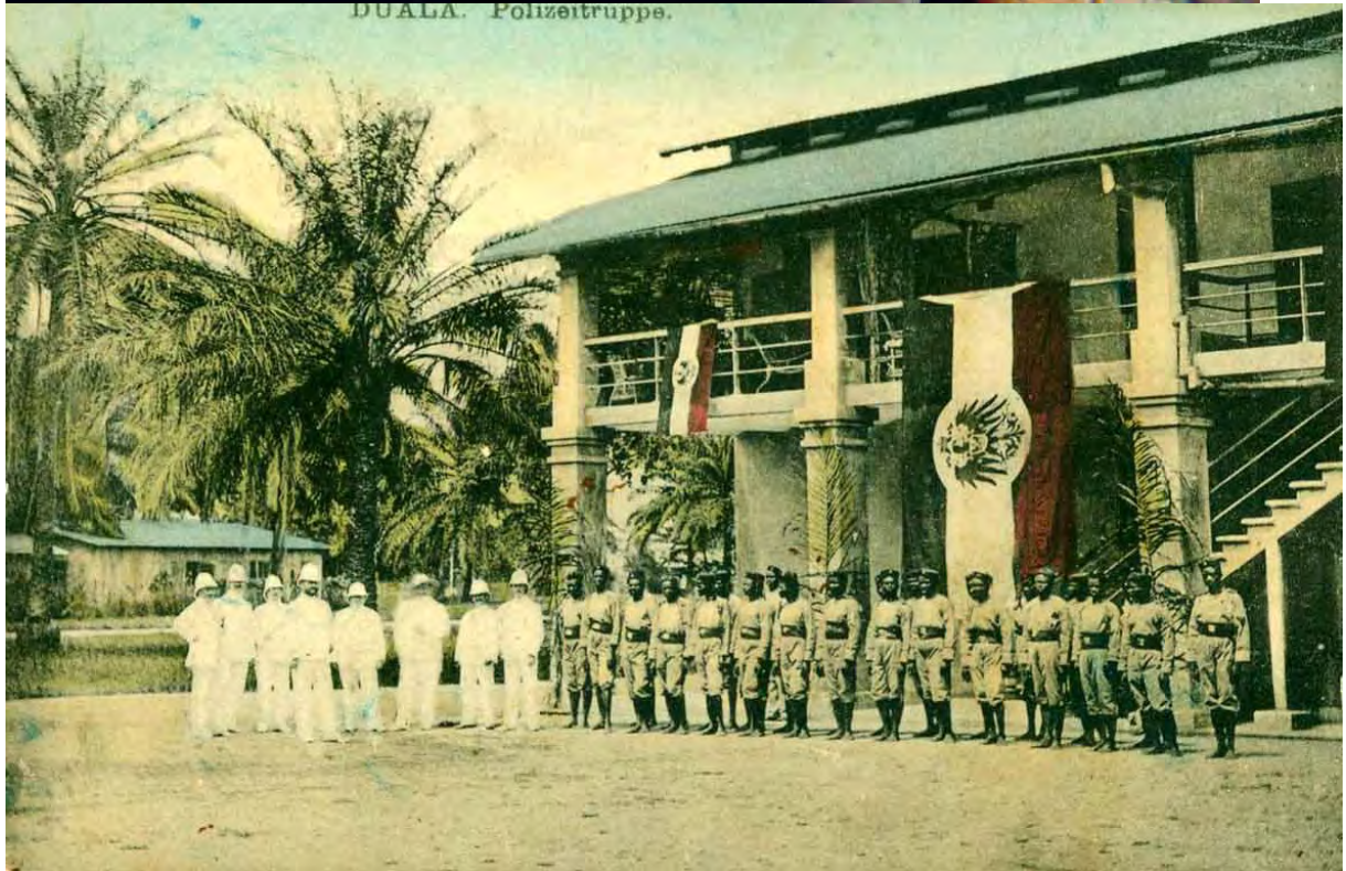
Polizeimeister und Gouverneursbeamte zusammen mit Polizeisoldaten vor dem Gouverneurspalast in Duala, Kamerun

Es handelt sich hierbei um eine erweiterte Fassung des im Deutschen Waffen-Journal 11/1992 erschienen Artikels.