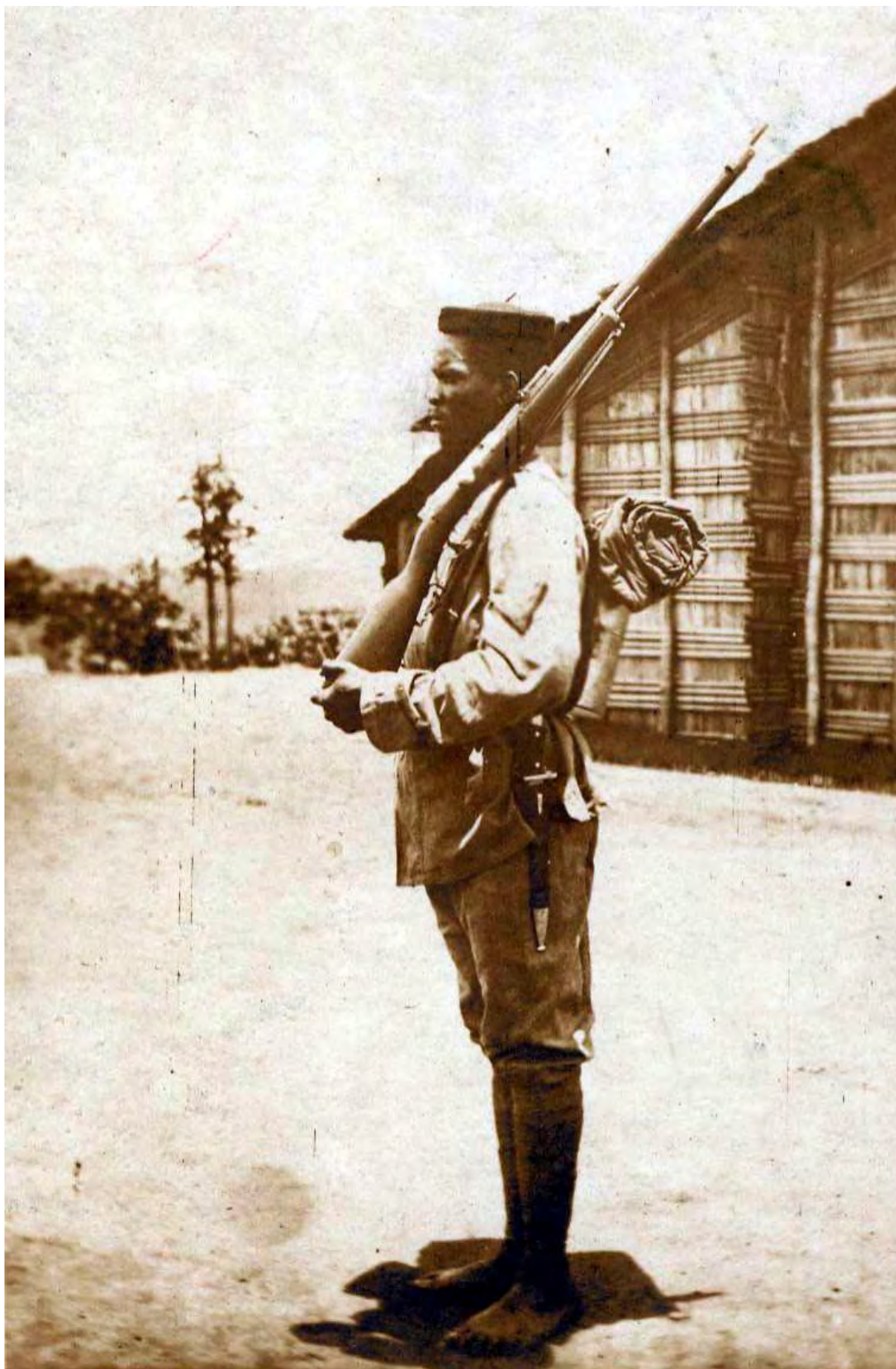
Angehöriger der Schutztruppe Kamerun